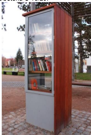
Špecifikácie – tvarové riešenie knihobudky, materiál neodpovedá požiadavkám

Kotvené kotviacou pätkou 900x600x800 mm z betónu C 16/20.