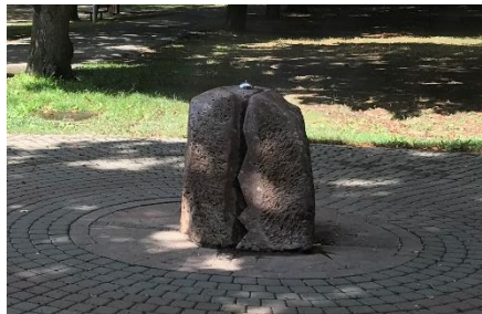
Špecifikácie – stávajúci pítka umiestené na hlavnej ose