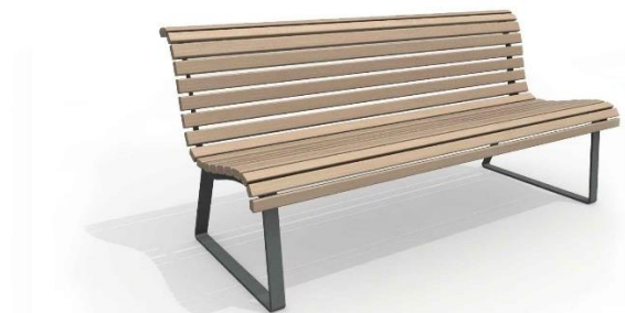
Špecifikácia – lavička (inspirační obrázok)