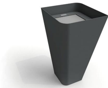
Špecifikácia – odpadkový kôš (inspirační obrázok)

Kotvenie kotvené pätkou 600x300x300 mm z betónu C 16/20