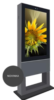
Špecifikácia – panel informačného systému (inšpirační obrázok)

Materiál: hliníkové telo, čierna farba, LED obrazovka.